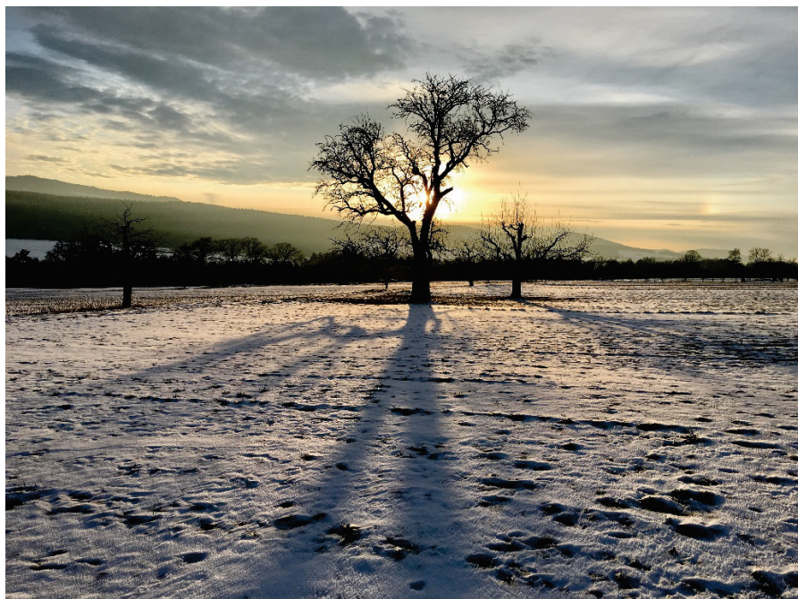
Winterstimmung auf dem Dittinger Feld