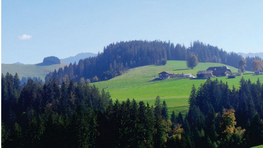
Aussicht auf Blapbach 1200 Meter über Meer