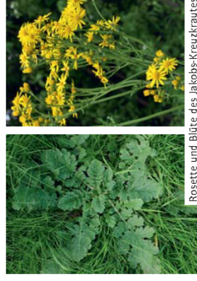
Rosette und Blüte des Jakobs-Kreuzkrautes

Das einheimische Jakobs-Kreuzkraut ( Senecio jacobaea ) und das Wasser-Kreuzkraut ( Senecio aquaticus ) sind für Tiere ebenfalls giftig. Die Bekämpfung dieser Arten wird deshalb empfohlen. Im Unterschied zum Schmalblättrigen Kreuzkraut haben Jakobs- und Wasser-Kreuzkraut gefiederte Blätter und wachsen anfänglich als Rosetten, bevor die Pflanzen in die Höhe wachsen und ähnlich dem Schmalblättrigen Greiskraut blühen.