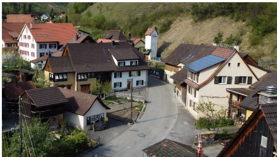
Foto: Verwaltung mit Drohne