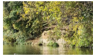
Eisvogelbrutwand Ergolz