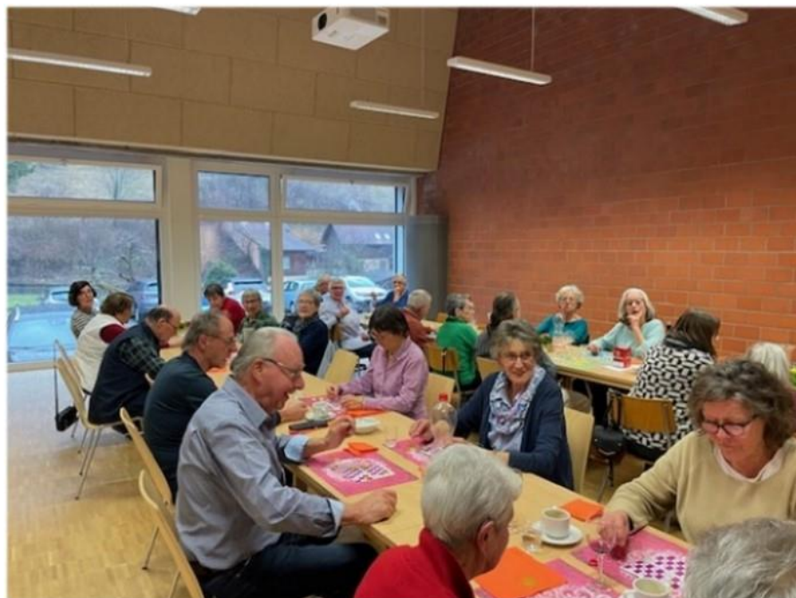
Mittagstisch für Senioren